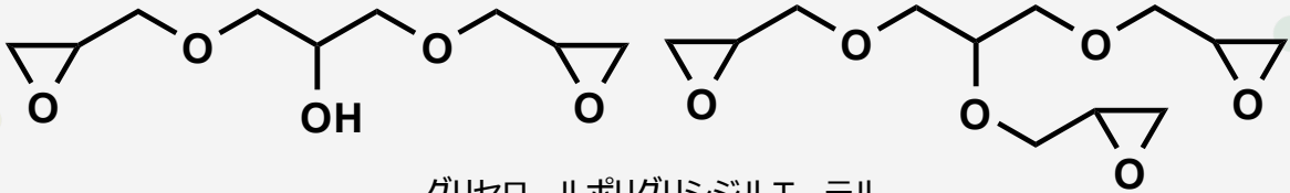
グリセロールポリグリシジルエーテル